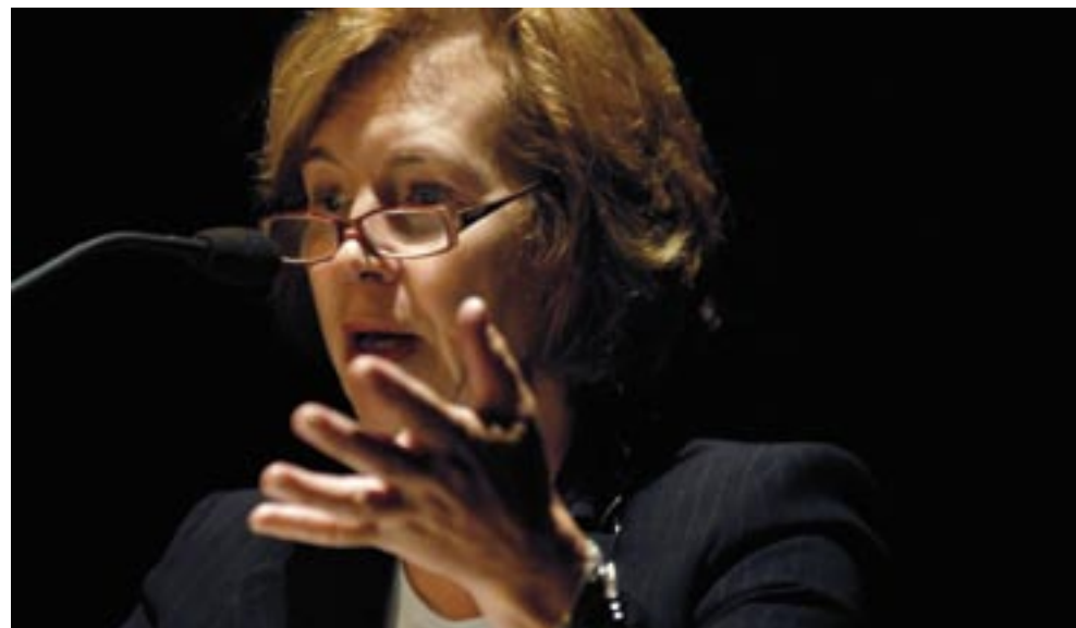
Tineke Netelenbos, waarnemend burgemeester van Ede