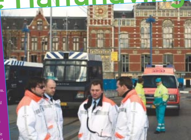
75% van de burgemeesters: Handhaven in de gemeente krijgt voldoende politieke prioriteit.