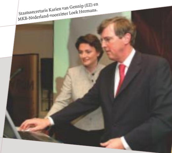
Staatssecretaris Karien van Gennip (EZ) en MKB-Nederland-voorzitter Loek Hermans.