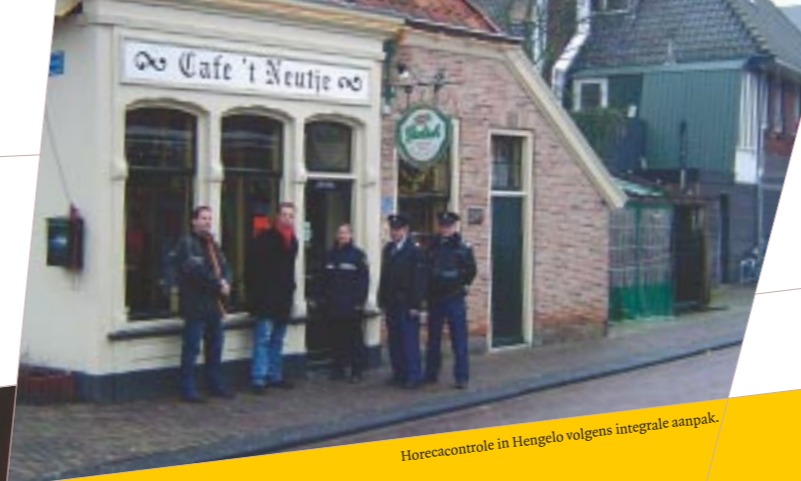
Horecacontrole in Hengelo volgens integrale aanpak.

Voor het project Handhaven op Niveau is de belangrijkste conclusie dat strijdigheden primair veroorzaakt worden door de verschillende interpretaties van de betrokken instanties. Samenwerking is dus van essentieel belang. De Stuurgroep Handhaven op Niveau probeert samenwerking te stimuleren, aangezien op dit punt winst te verwachten is.