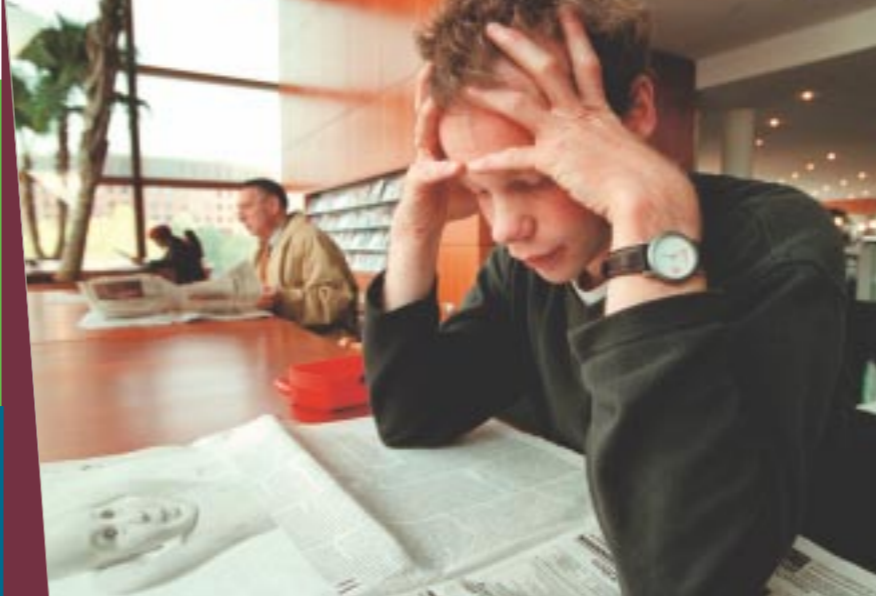
Krant lezen stimuleert de omgevingsbewustheid.