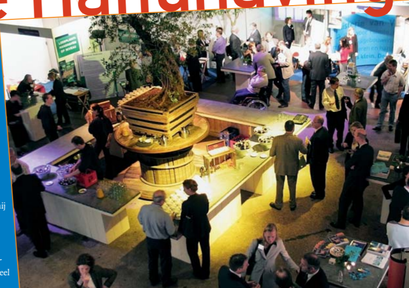
Met grote voortvarendheid is de afgelopen jaren gewerkt aan de handhaving.