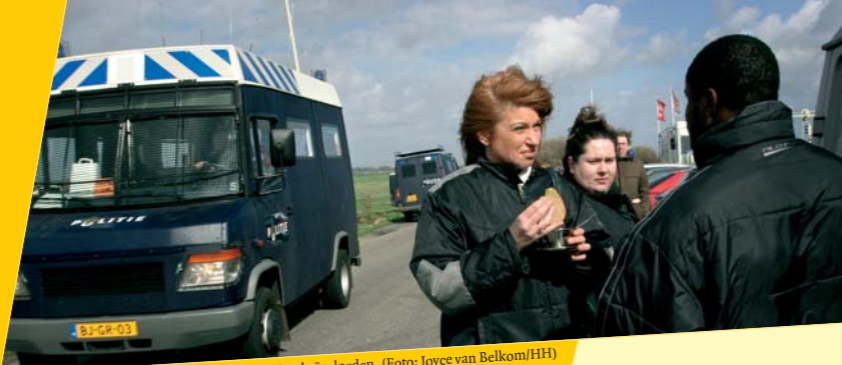
Publieke druk kan een handhavingsbeslissing beïnvloeden.

De ernst van de overtreding is voor gemeenten bepalend voor de beslissing om wel of niet handhavend op te treden. Goede tweede is de juridische haalbaarheid van de handhaving. Maar ook subjectieve afwegingen spelen een rol. Dit blijkt uit een onderzoek door de Universiteit van Tilburg onder handhavingsambtenaren en wethouders.