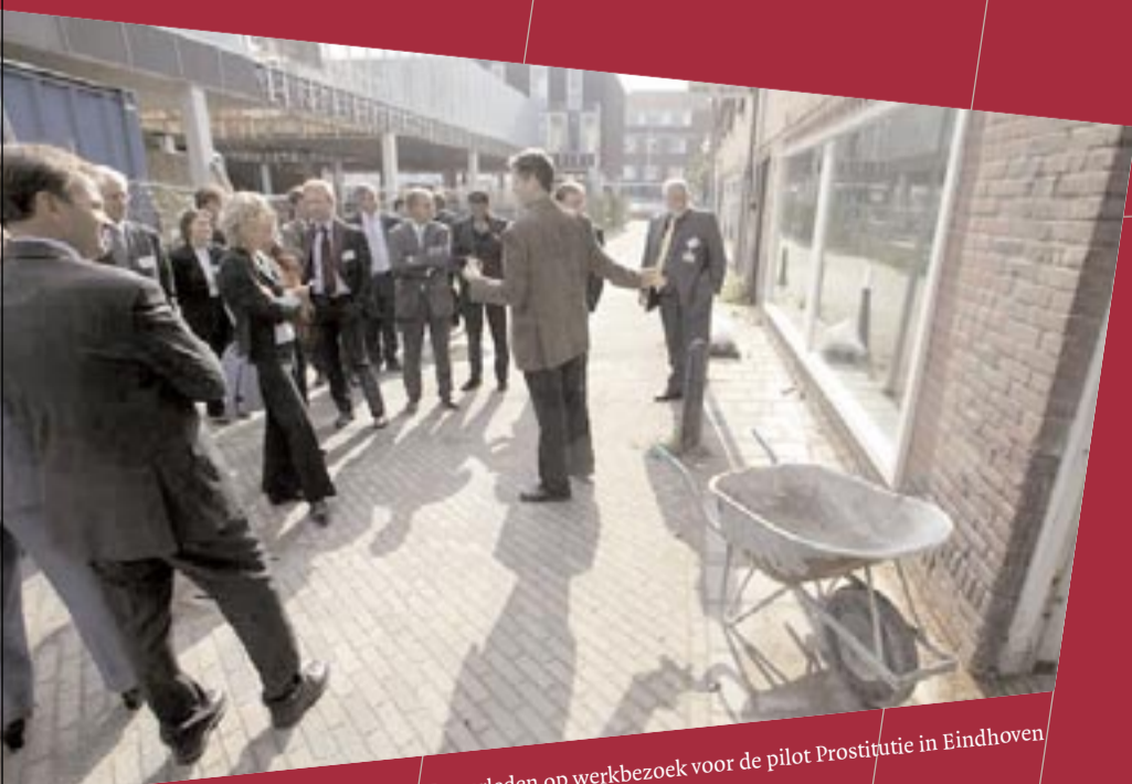
Tweede-Kamerleden op werkbezoek voor de pilot Prostitutie in Eindhoven