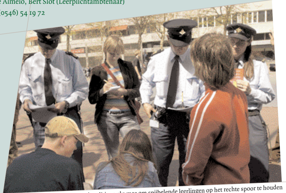
Ook politie werkt mee om spijbelende leerlingen op het rechte spoor te houden