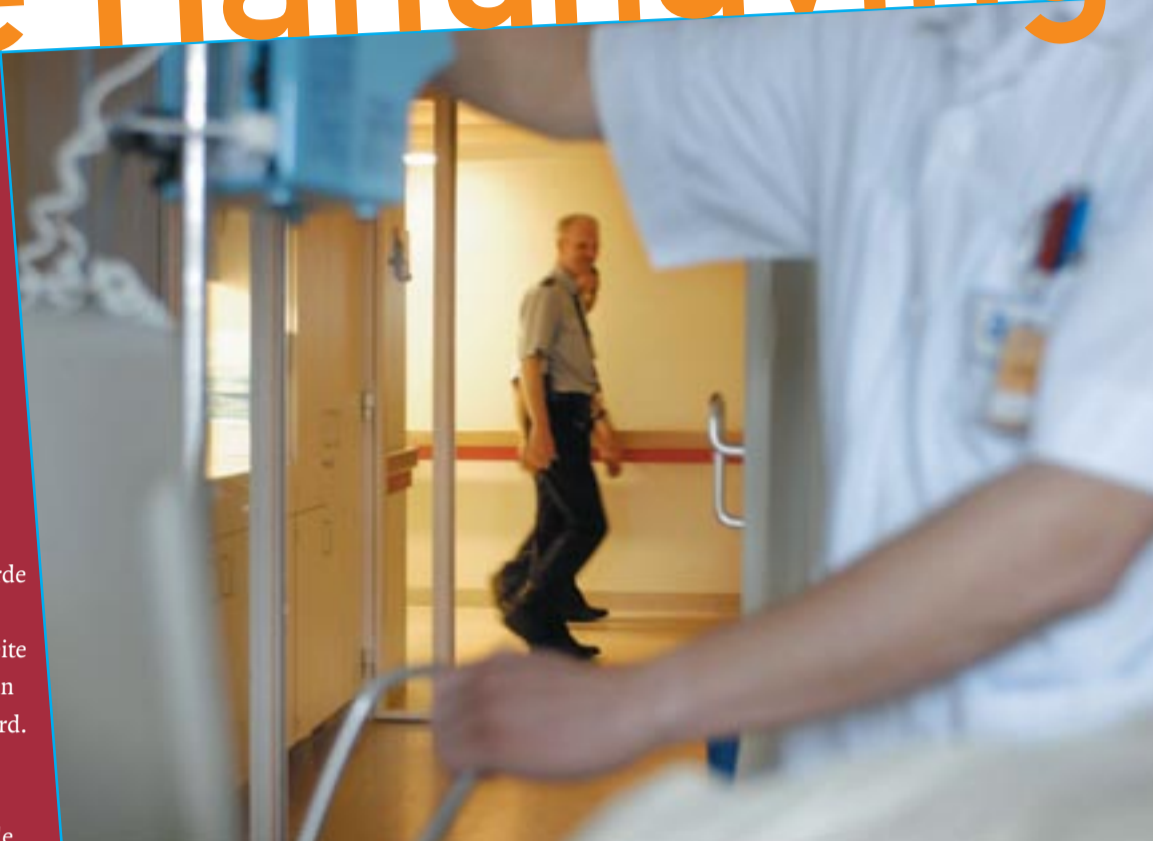
Veiligheidsconcept Academisch Ziekenhuis Groningen omvat alle risico's

Het actieprogramma Handhaven op Niveau stimuleert en faciliteert overheden en handhavende instanties bij het werken aan handhaving. Het bevordert daartoe verdere professionalisering van handhaving en samenwerking tussen alle betrokkenen.