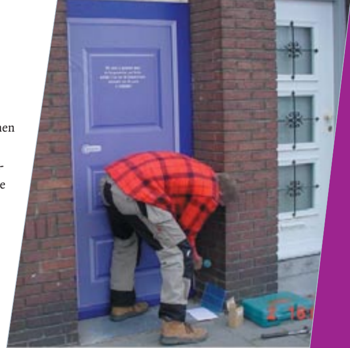
De sluiting van een drugsgerelateerd pand in Venlo