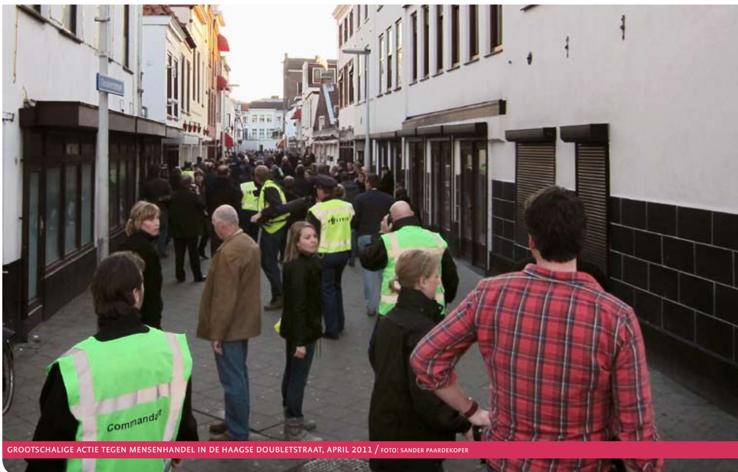
GROOTSCHALIGE ACTIE TEGEN MENSENHANDEL IN DE HAAGSE DOUBLETSTRAAT, APRIL 2011