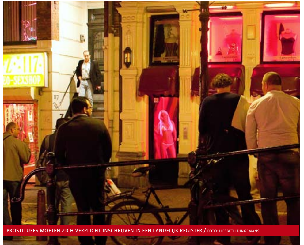
PROSTITUEES MOETEN ZICH VERPLICHT INSCHRIJVEN IN EEN LANDELIJK REGISTER

De gemeente Eindhoven wordt waarschijnlijk zo’n gemeente die de registratie uit moet voeren. Koopmans: “De gemeente moet dat organiseren, een locatie zoeken en andere deskundigen inschakelen, zoals de GGD.” Dat moet, maar dat is ook nuttig, volgens het onderzoek van Koopmans. “De taken toezicht en handhaving worden dan wel losgekoppeld, de toezichthouders en handhavers hebben elkaar wel nodig. Bijvoorbeeld om kennis en expertise te delen.” Huijgens doet een voorzet van hoe dat er in de praktijk kan uitzien: “Misschien dat er koppels de straat op gaan: met een ‘toezichthouder’ vanuit de gemeente en een ‘handhaver’ van de politie. Want uiteindelijk hebben zij hetzelfde doel: een betere situatie voor prostituees en minder misstanden in de branche.”