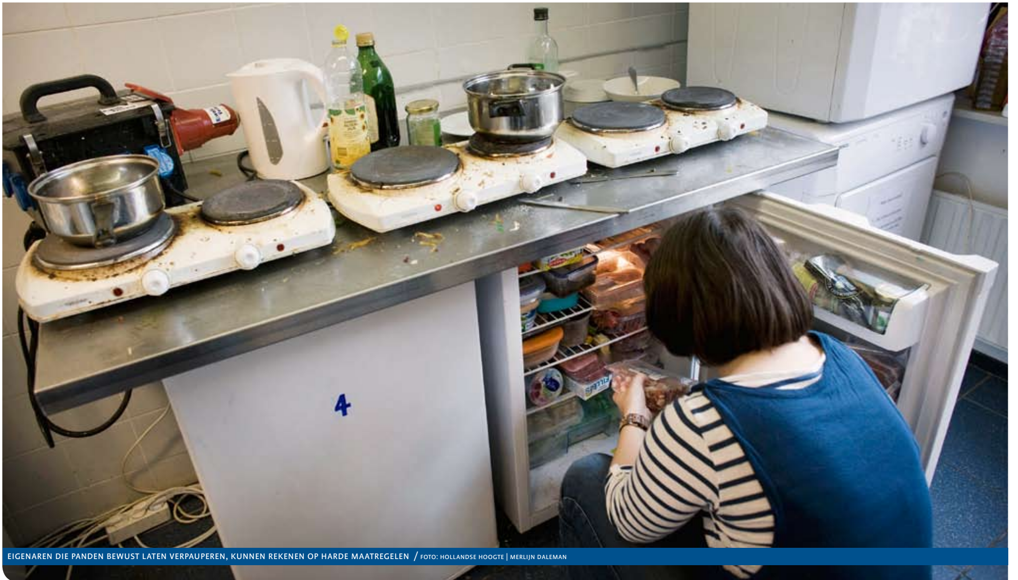
EIGENAREN DIE PANDEN BEWUST LATEN VERPAUPEREN, KUNNEN REKENEN OP HARDE MAATREGELEN

De praktijken van huisjesmelkers bezorgen bewoners én mensen in de buurt overlast. Vaak is sprake van slecht onderhoud en overbewoning, soms ook van hennepsteelt. Op den duur kan hierdoor een complete buurt verloederen. Voor gemeenten is het dan ook zaak vroegtijdig in te grijpen. Maar met welke instrumenten? Welke aanknopingspunten bieden wet- en regelgeving om huisjesmelkers een halt toe te roepen. En hoe doen andere gemeenten dat?